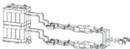
BAT250 - EL002407

Tato rozšiřující jednotka obsahuje vstupy a napájení pro elektromotorický zámek, volič režimů klíčového spínače, vstup pro akumulátory, funkci EPS, Otevření/Zavření, otevření klíčem a vnější impuls, monitoring stavu akumulátorů.