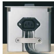
Elektrické a datové přívodní kabely