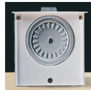
Rotační mechanismus s elektomotorem