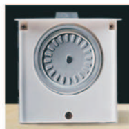
Rotační mechanismus s elektomotorem