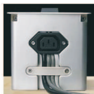
Elektrické a datové přívodní kabely